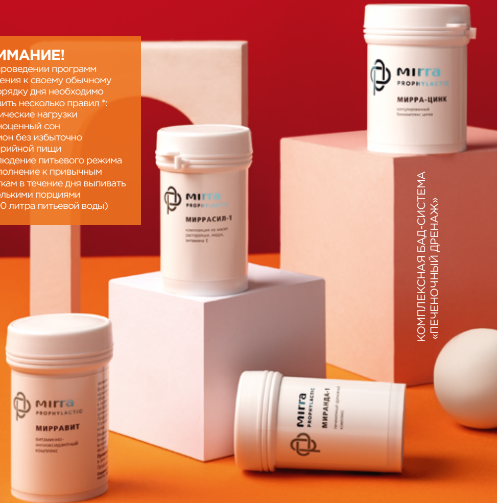
КОМПЛЕКСНАЯ БАД-СИСТЕМА «ПЕЧЕНОЧНЫЙ ДРЕНАЖ»

При проведении программ очищения к своему обычному распорядку дня необходимо добавить несколько правил *: • физические нагрузки • полноценный сон • рацион без избыточно калорийной пищи • соблюдение питьевого режима (в дополнение к привычным напиткам в течение дня выпивать несколькими порциями 0,5 - 1,0 литра питьевой воды)